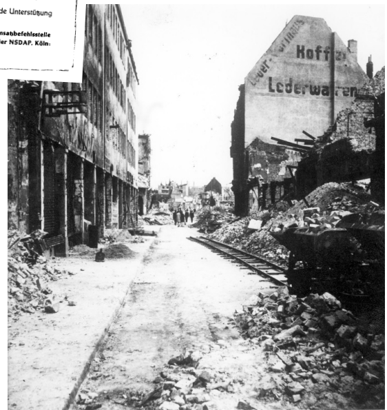
Buchheimer Straße nach dem 28.10.44 mit dem zerstörten Textilhaus Feinhals

„Der 28. Oktober 1944 ist ein strahlend schöner Herbsttag. Viele Menschen nutzen das Wetter zu einem Spaziergang. Um 15.05 Uhr ertönte Fliegeralarm, danach Entwarnung, die Flieger haben abgedreht. Aber das war eine Täuschung. Um 15.44 Uhr erreichen die Bomber der Royal Airforce ihr Zielgebiet: Mülheim. ... Viele Menschen sind nicht in ihren Kellern, sondern auf der Straße, in Geschäften, in Kinos.